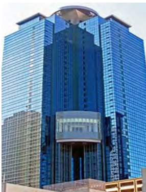
移転されたばかりのオフィス 新宿オークタワー

1997年アジア通貨危機の際、韓国は国として破綻しました。再建のために、国がとった政策は外貨を稼ぐこと。サムソンをはじめ、グローバル企業を育て先進国に返り咲きました。このとき、キーワードになったが語学力です。(次ページへ)