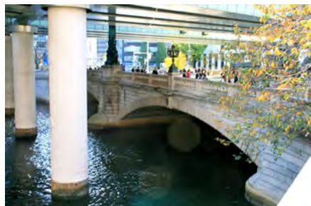
(上) 上図と同じ方向から(魚河岸の跡地から)、現在の日本橋を撮影(筆者)。昔日の面影はない。

魚河岸・魚市場は草創以来三百年間、日本橋北詰にあつたが、大正十二年(一九二三)の関東大震災で壊滅し、その年の内に築地に移転した。ヤッチャバ(野菜市場)も一緒に築地市場として、現在に至っているが、二〇一八年には豊洲に移転する。 〈四一回 西岡恒憲〉