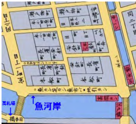
(上) 江戸切絵図<尾張屋清七版(嘉永頃-1850頃)>日本橋北詰の東側一帯が魚河岸・魚市場であった。

早い時期から、日本橋の南詰の西側には幕府の高札場があり、また北詰の東側一帯がいわゆる魚河岸・魚市場であった。 江戸幕府開府以来、江戸の漁師(主に佃島)や魚商は幕府や諸大名の魚御用を主に務めていて、余った魚を日本橋の袂で売り始めたのが魚市場の始まりである。魚河岸は寛永度(一六二四―一六四四)からこの辺にあつたのだが、天和頃(一六八二頃)から諸大名をはじめ、江戸市民上下も次第に贅沢になって、魚の