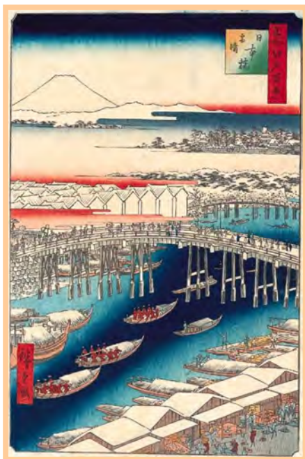
(上) 歌川廣重「名所江戸百景」より「日本橋雪晴」(安政四年頃-1857年頃)日本橋北詰から南西を望んだ俯瞰図。右下に見えるのが魚河岸と魚市場。日本橋川の水上には朝早くから多くの荷船が行き交う江戸一の殷賑の地だった。

しかし江戸っ子は何もこの河岸っ子に限ったことではない。神田っ子、深川っ子など地域によって少しだけ気質が