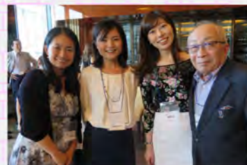
憧れの先輩方とパチリ