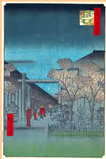
(上) 歌川廣重「名所江戸百景」より「廓中東雲」(安政四年頃-1857年頃) 吉原の曙の図。頬かむりして朝帰りする客を見送る遊女が描かれている。この門は吉原大門(おおもん)ではなく、廓内の各町を仕切る木戸の一つである。

その後も江戸の発展に従い、江戸周辺地域の百姓の次男三男四男が職を求めて江戸にやってくる。そんなこんなで江戸には上下の別なく独身の男が満ち溢れ、男の数が女の数を常に上回るという状態が幕末まで続いたのである。江戸時代の人口統計は甚だあてにならない体のものであるが大体の人口の傾向は読み取れるので、参考のため嘉永六年(一八五四年)の統計を挙げると、男二九万五五五三人、女二七万九四七二人となっている。これは市街地だけ、つまり町奉行支配下の分(武家寺社を除く)だけだが、飢饉に対するお救いのため人数改(あらため)をやった記録である。「しかし実際は、女の数が少ないというよりも、独身者が多い。土にしても町人にしても、江戸は独身者の多いところだったのです。」(三田村篤魚)