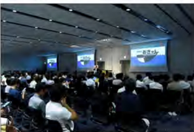
顧客のイベントを企画運営する傍ら 昨年より自社イベントを主催。 2019年も開催予定。