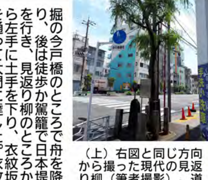
(上) 右図と同じ方向から撮った現代の見返り柳。道路は日本堤通り。ビル群の後方には暗渠になった山谷堀がある。

これが元吉原に対して新吉原と呼ばれ、昭和36年の赤線廃止まで二百年続いたのである。新吉原の町割も元吉原と同じく、大門(おおもん)を入って仲之町、それに交差する左右の町が江戸町一丁目、同二丁目、揚屋町、角町、京町一丁目、同二丁目と、いわゆる五丁町に区分されていた。江戸の嬢客が吉原通いをす(ちよきぶね)に乗り、猪牙舟(ちよきぶね)に乗り、隅田川を遡り、お蔵前の首尾の松に今夜の上首尾を祈り、山谷