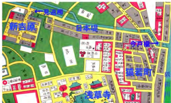
(上) 江戸切絵図<尾張屋清七版 嘉永頃-1850頃> 遊客は山谷堀出口の今戸橋で舟を降りて日本堤(山谷堀の土手道)を徒歩または駕籠で新吉原に向かった。

江戸を語るとなると、吉原はどうしても避けて通れない。幕藩体制下の江戸の娯楽というものは、現代に比べればはるかに少なく、最大級の娯楽といえ、江戸三座の芝居と新吉原であった。江戸の三大祭や両国川開きは一時的なものであり、両国広小路や上野山下の賑わいも江戸っ子にとっては楽しみではあっても極め付きの娯楽と言うほどのものではなかった。限られた紙面なので、吉原に関する種々の逸話や遊女列伝、遊女の階級の変遷等は省いて、新吉原の成立と歴史を平板に見てみよう。