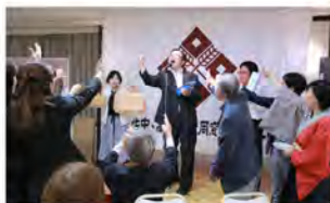
昨年の総会懇親会から