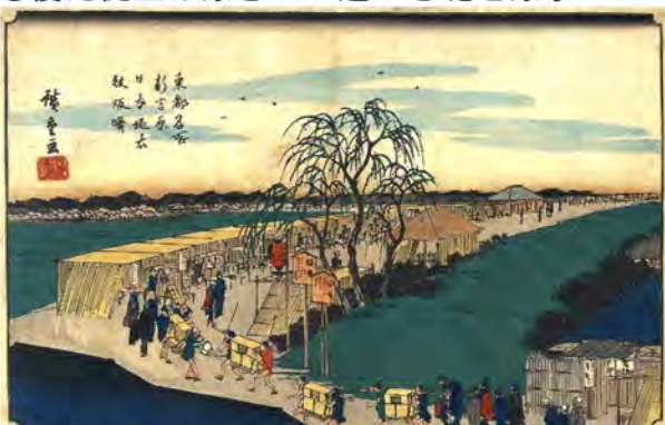
(上) 歌川廣重「東都名所」より「新吉原日本堤衣文坂曙」(天保五年頃-1833年頃)。手前の吉原大門に続く衣文坂から日本堤に上がるところを、朝帰りの遊客が駕籠や徒歩で帰っている。曲がり角に見返り柳が描かれている。ここで朝帰りの客が名残惜しげに廓の方向を振り返ったので見返り柳と呼ばれた。