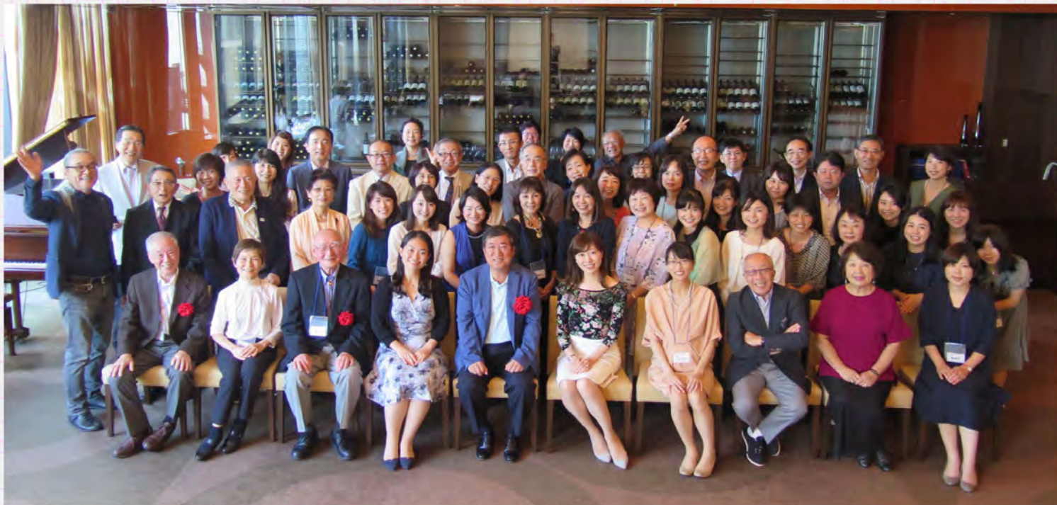
銀座並木通りのICONIC (アイコニック) は明るい店内 おいしい食事話も弾みました